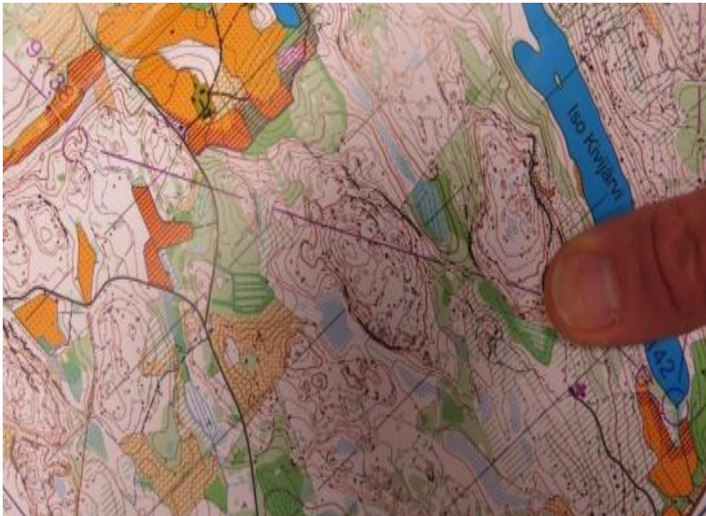
Ratkaisuvälit 7-9 peukalo-ote

Vilkaisin karttaa ja ihmettelin, että missä se kasi oikein oli. Oho, heti ensimmäisen TV-rastin ja juomapaikan jälkeen eturinteessä. Samalla ymmärsin, miksi porukka lähti juomapaikalta oikealle menevää uraa. Joka tapauksessa koko rastilla en ollut käynyt, joten selvä hylsy. Virallisia dokumentteja varten toimitsija tarkisti vielä leimantarkistuspuhvin, vaikka ilmoitin, että rasti jäi väliin. Piti vielä allekirjoittaa lomake, jossa hyväksyin tuomion. Lievästi ihmetellen talsin karttaa tuijottaen teltalle. Harmitti kavereiden takia, kun näin typerällä tavalla hyvät sijoitus valui käsistä